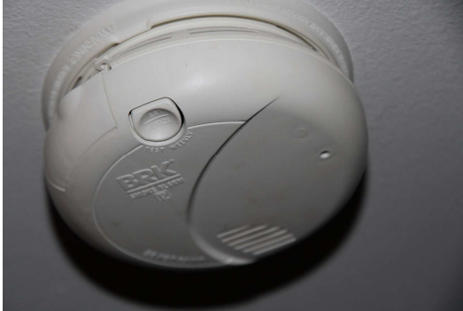
Détecteur de fumées – Plafonnier