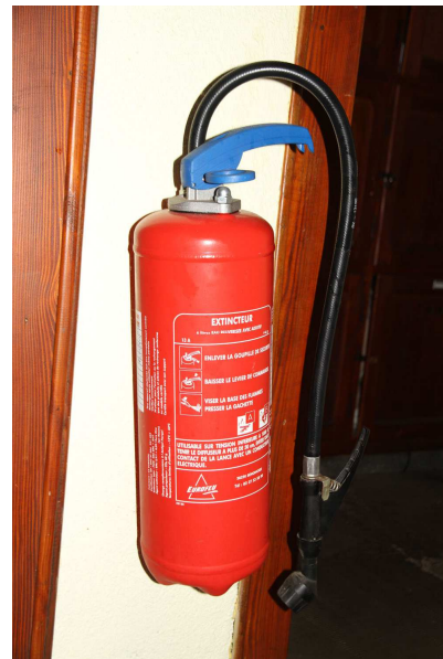
Extincteur hall d'entrée

Se référer aux instructions sur chaque extincteur.