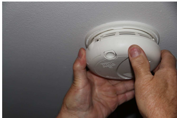
Retrait du plafonnier

Retirer le plafonnier en le tournant d'un quart de tour, ouvrir le compartiment pile qui se situe de côté et retirer la pile usagée.