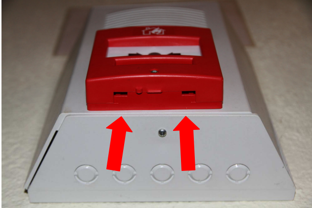
Introduction clef par le dessous

L'arrêt de cette alarme ne peut se faire qu'avec l'introduction d'une clef spécifique par le dessous de l'alarme. La clef est stockée dans le placard de la cuisine