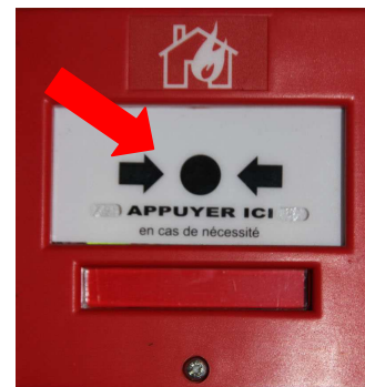
Bouton de déclenchement - Alarme manuelle

Les alarmes manuelles émettent un signal sonore puissant dès qu'un appui sur le bouton en façade est détecté. Si aucune interruption volontaire est menée, la durée d'émission est de 5 minutes.