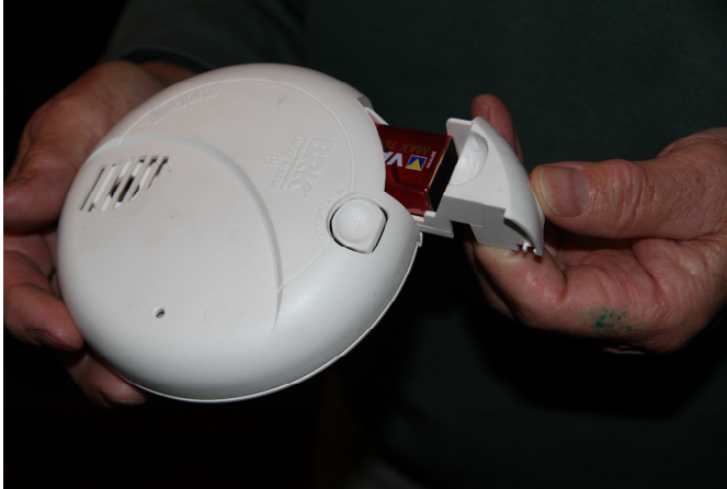
Compartiment de la pile

Chalet – Refuge au Rossberg-Waldmatt Altitude : 1100 m. Accès : Col du Hundstüch par route Joffre