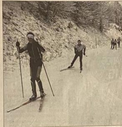
Au SC Ranspach, on a déjà pu rehausser les skis au Bretfirst. Les récentes chutes de neige devraient permettre aux skieurs de prendre possession du Markstein à partir de ce vendredi.

« C'est un peu la sinistrose dans les clubs. Certains ont renoncé à faire quoi que ce soit. Le confinement est arrivé